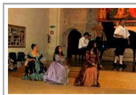
Concerto allievi corso di canto