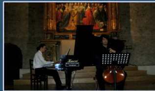
CONCERTO ALLIEVI VIOLONCELLO

info www.umbriaclassica.com fernandomartinelli5@gmail.com cell. 348.0527841