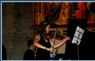
CONCERTO ALLIEVI VIOLINO