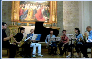
CONCERTO GRUPPO SAX