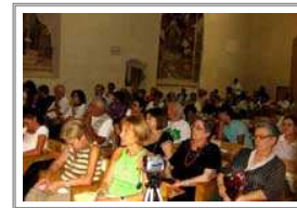
Pubblico ai concerti

www.umbriaclassica.com fernandomartinelli@libero.it Tel. 348.0527841 - Tel. 340.7896840