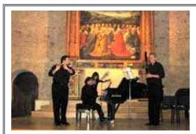
Concerto Zoni–Screpis–Di Cesare